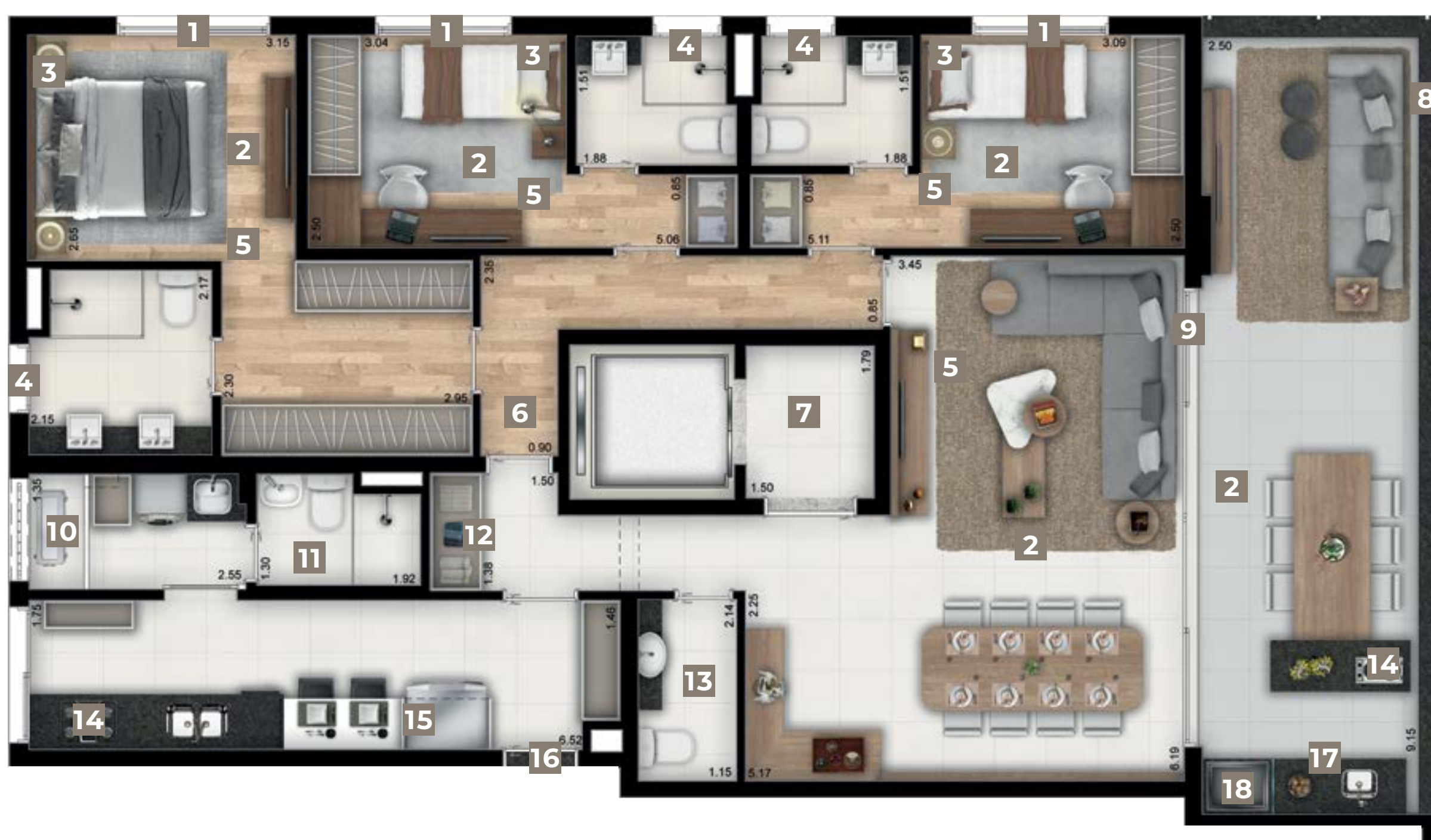
ILUSTRAÇÃO ARTÍSTICA DA PLANTA DE 151 M 2 COM SUGESTÃO DE DECORAÇÃO, SUJEITA A ALTERAÇÃO.