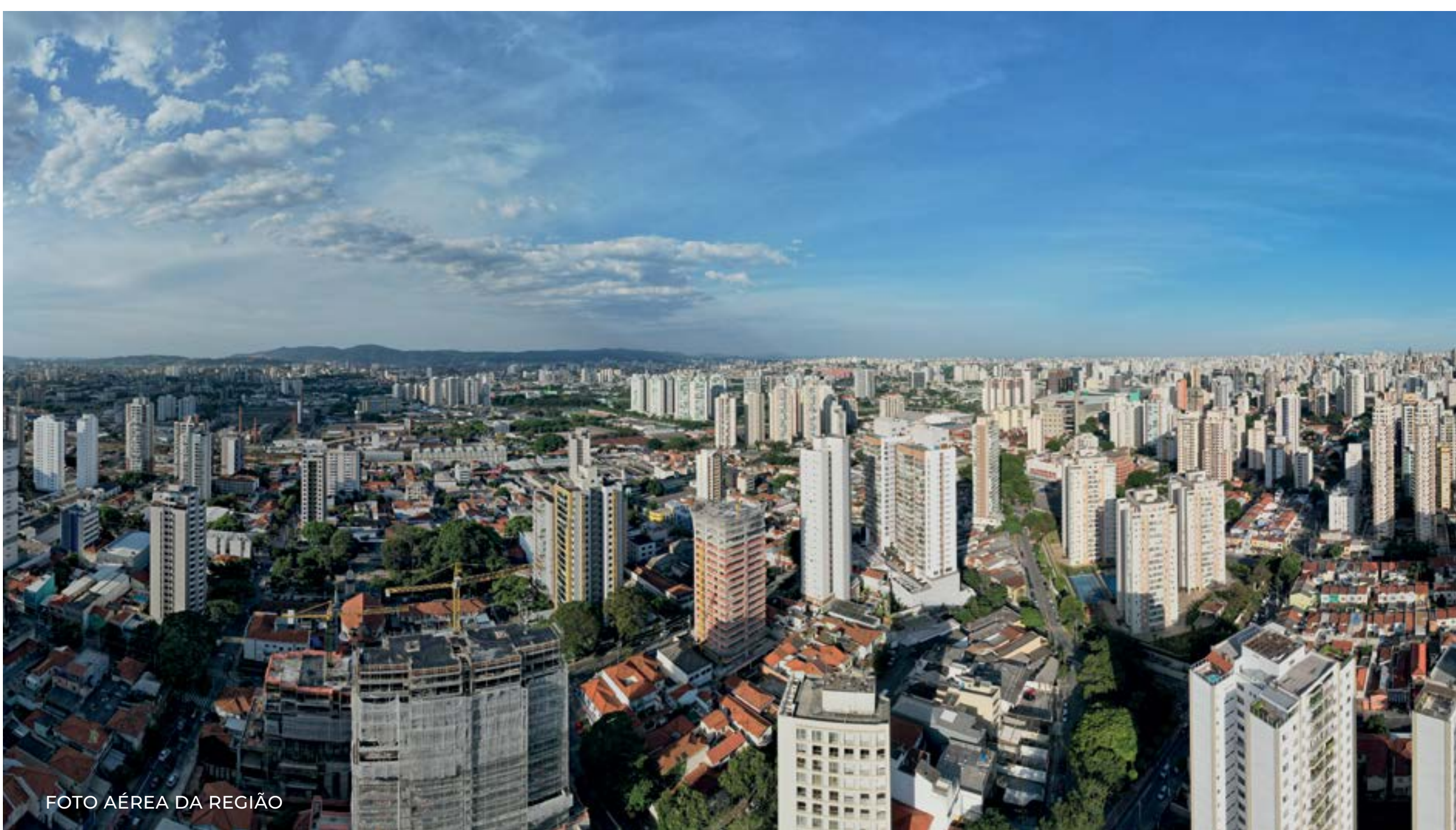
FOTO AÉREA DA REGIÃO