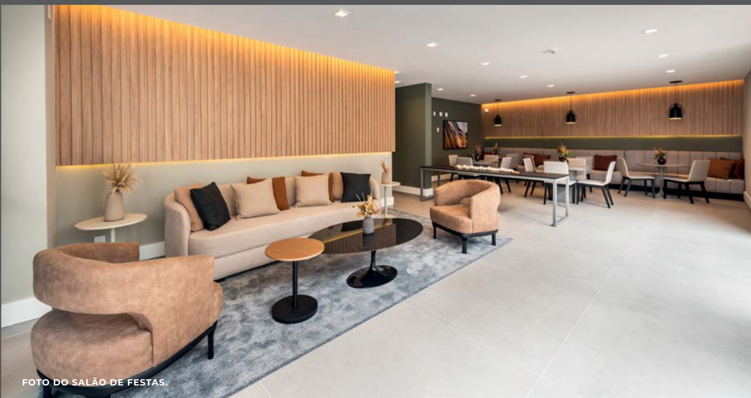
FOTO DO SALÃO DE FESTAS.