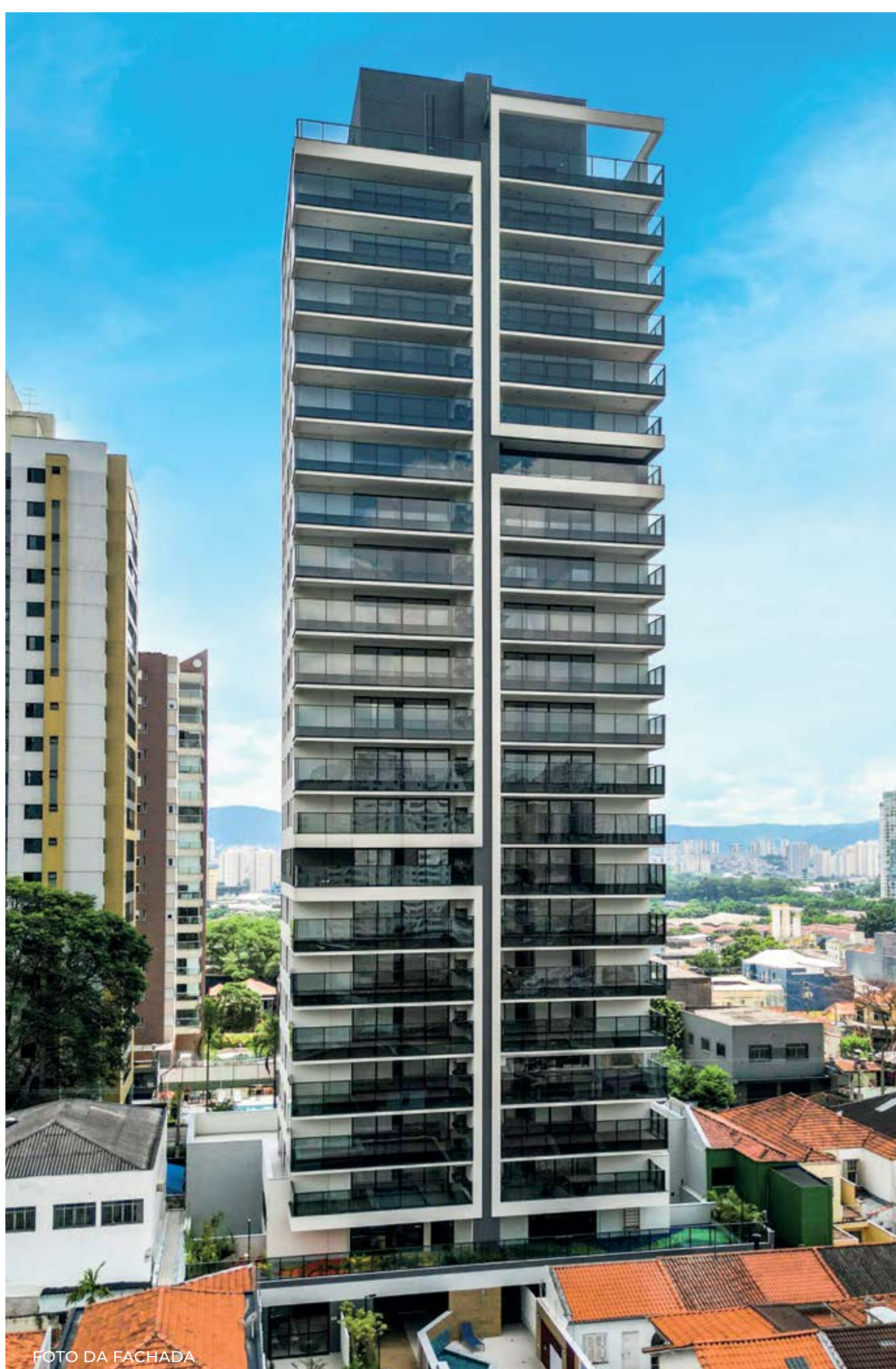
FOTO DA FACHADA