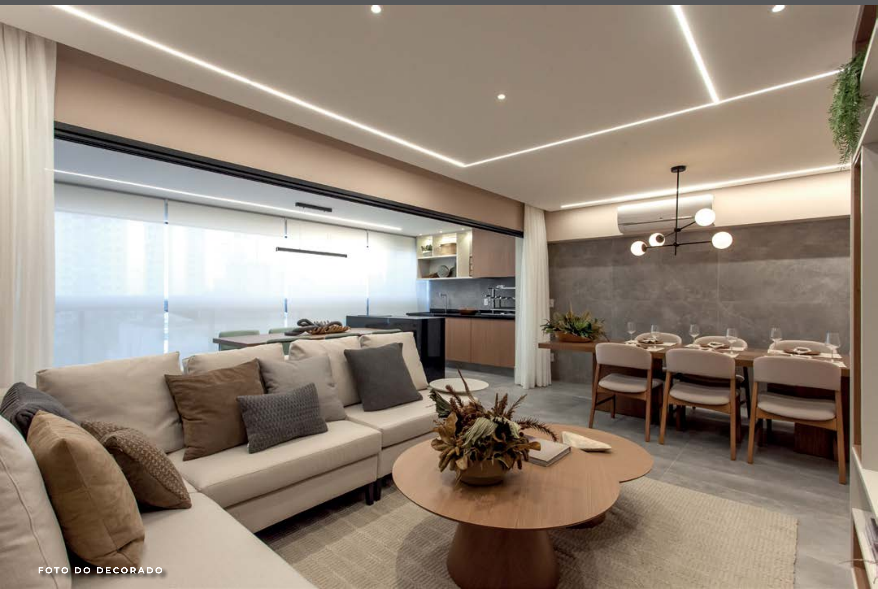
FOTO DO DECORADO