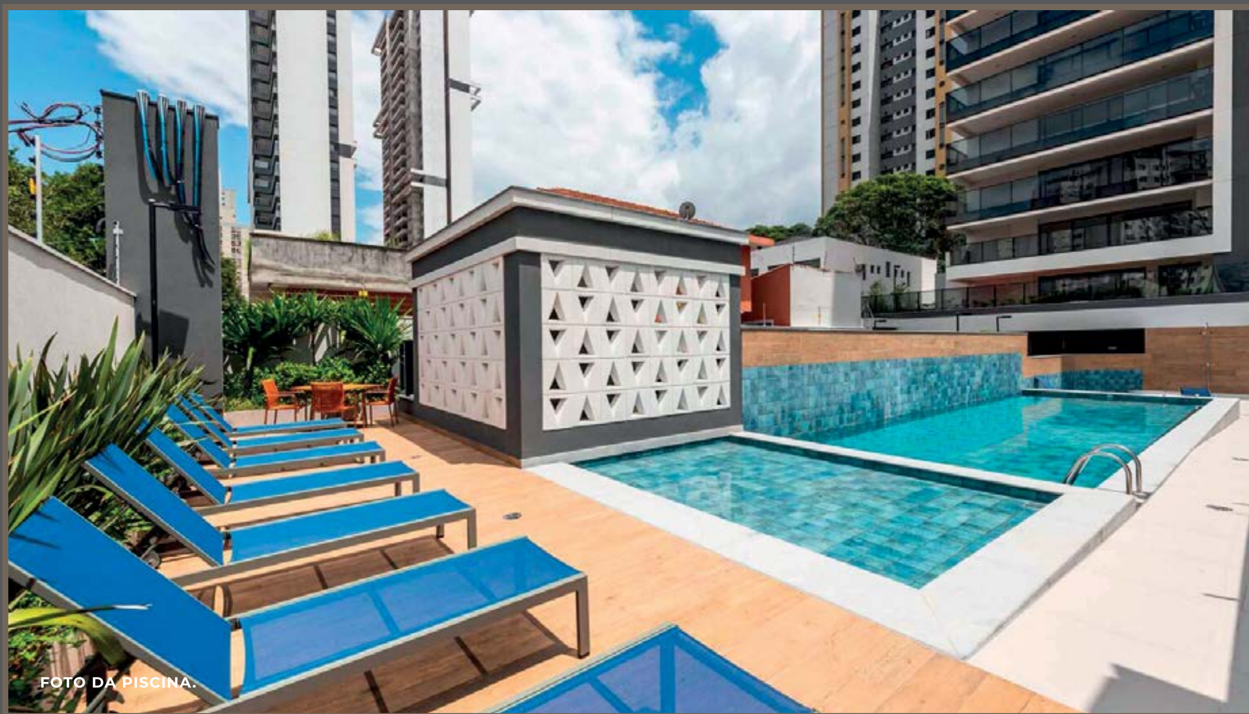
FOTO DA PISCINA.