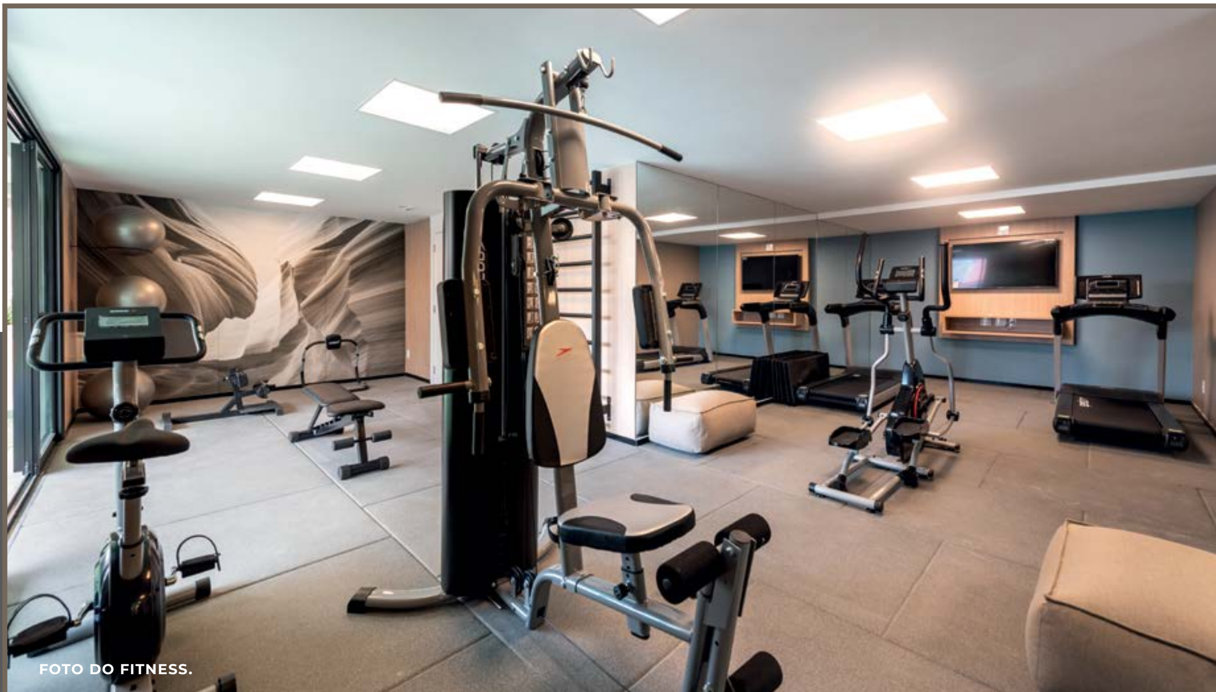
FOTO DO FITNESS.