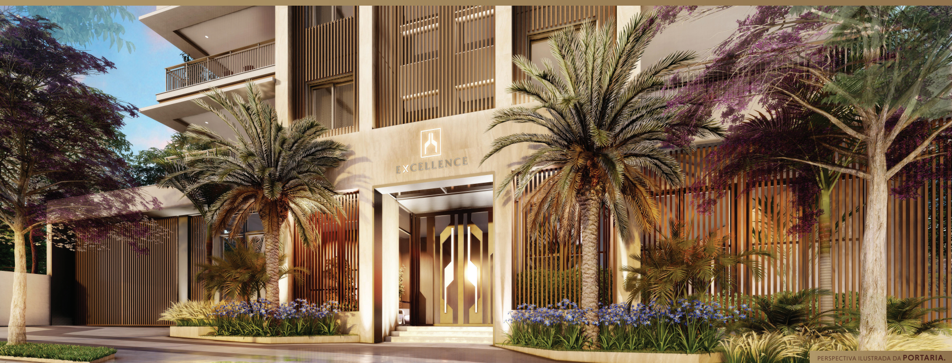
PERSPECTIVA ILUSTRADA DA PORTARIA.